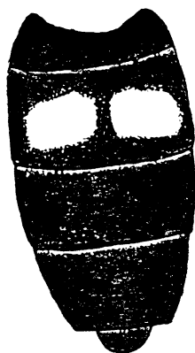
图 149 黄跗缩颜蚜蝇 Pipiza luteitarsis Zetterstedt